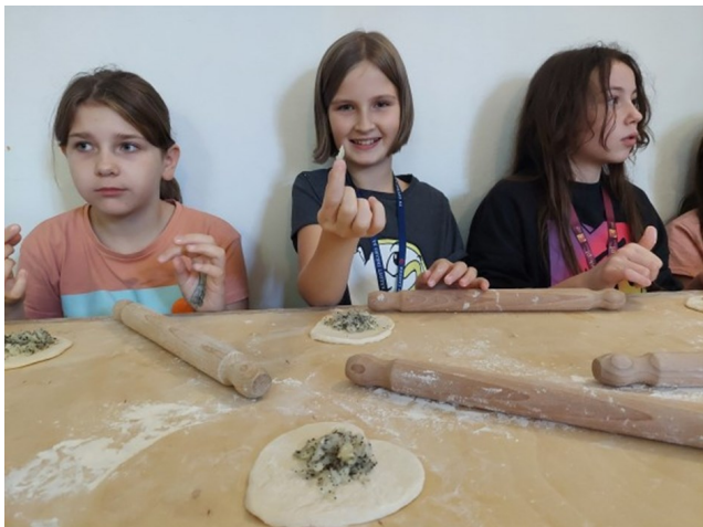
Regionalne Centrum Cebularza