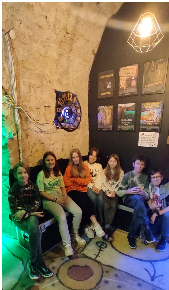
Festiwal Literatury Dziecięcej